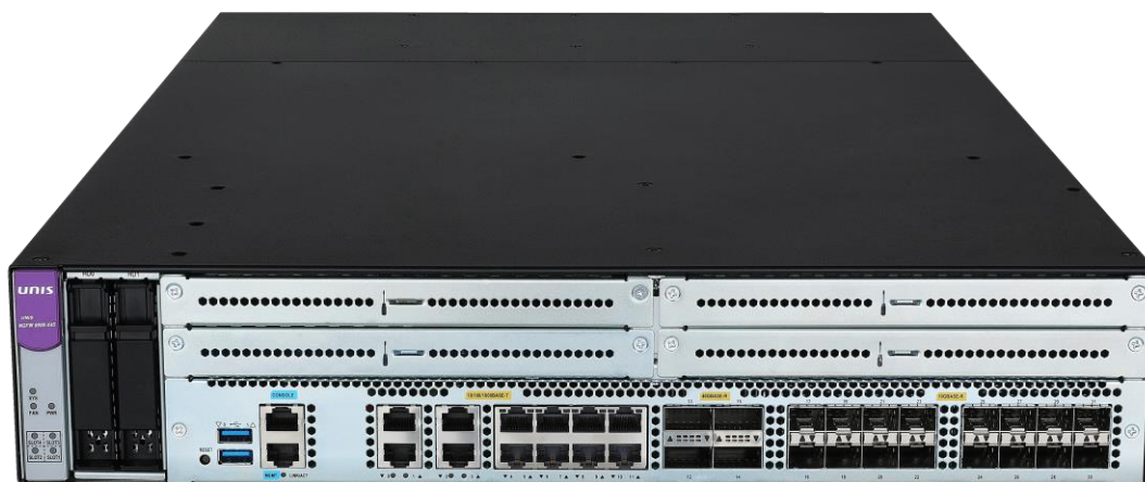
UNIS NGFW 8000-X45

UNIS NGFW 8000-X45 和 NGFW 8000-X25 防火墙是紫光恒越技术有限公司（以下简称 UNIS 公司）伴随 Web2.0 时代的到来并结合当前安全与网络深入融合的技术趋势，针对大型企业园区网、运营商和数据中心市场推出的新一代高性能万兆防火墙产品。